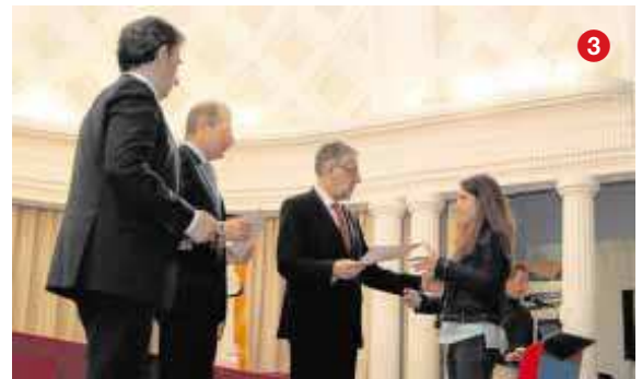
►►Escenas► 1► Todos los alumnos premiados ayer posaron juntos en el colegio Joaquín Costa de Zaragoza al acabar la entrega de premios de esta edición. 2 y 3► Dos momentos del acto, con los niños como protagonistas.