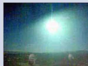
Imagen tomada desde Calar Alto.

Un niño de siete años vestido de cazador, con una escopeta en una mano y una perdiz muerta en la otra, es la portada del último número de Jara y Sedal . La publicación mensual, que lleva el nombre del programa de La 2 de TVE, ha desatado la polémica en las redes.