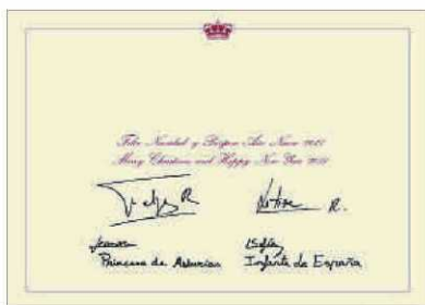
CASA DEL REY

Firmas. Este año, los Reyes y sus hijas han firmado en el interior del christmas debajo de la leyenda "Feliz Navidad y Próspero Año Nuevo", pero no han añadido, como en anteriores ocasiones, un mensaje. La chaqueta y la falda de la infanta Sofía y el jersey de la princesa de Asturias son de la firma Nanos de moda infantil