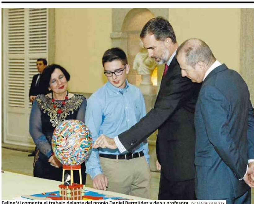
Felipe VI comenta el trabajo delante del propio Daniel Bermúdez y de su profesora.

ESPAÑA Iglesias y Errejón intentan salvar sus diferencias > 31