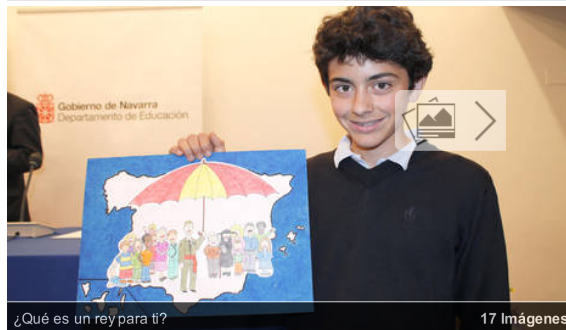
¿Qué es un rey para ti?