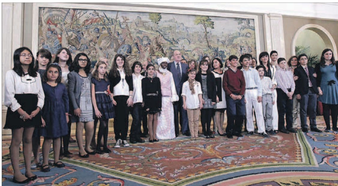
El Rey junto a los niños premiados, ayer, en Madrid.

Un escolar navarro compone una canción de hip hop para el monarca español en el concurso ¿Qué es un Rey para ti?