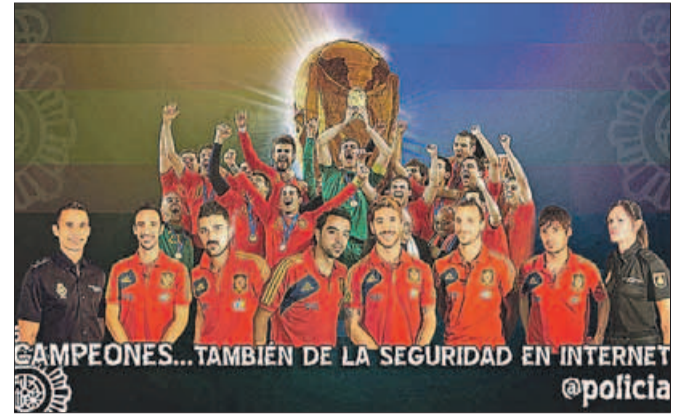
Campaña de la policía.

La Policía Nacional lanza una nueva campaña en las redes sociales para el uso seguro de internet con la participación de la selección española de fútbol. Bajo el lema Campeones... también de la seguridad en internet , los jugadores Xavi Hernández, Sergio Ramos, David Villa, David Silva, Roberto Soldado y Juanfran Torres dan cada uno un consejo para el uso seguro de la Red.