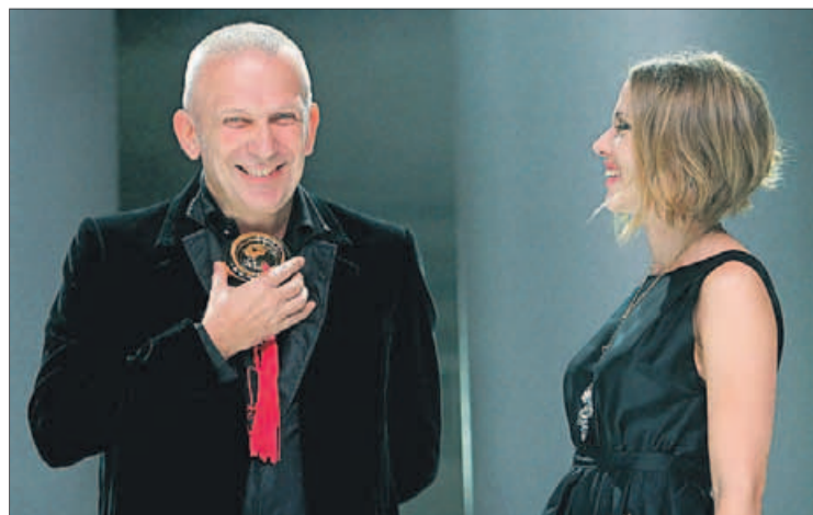
Gaultier con la actriz Scarlett Johansson.

mo invitado internacional de la feria de moda Cali Exposhow 2012, que comienza hoy en esa ciudad colombiana. Gaultier presentará su última colección en la noche del miércoles en esta pasarela de América del Sur.