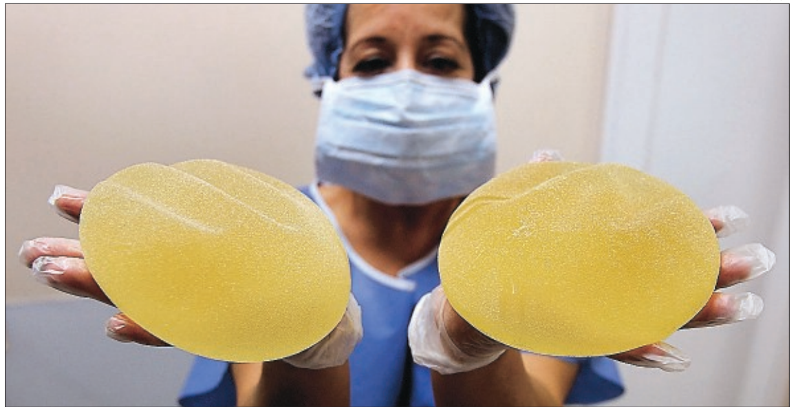
Corporación mostraba unas prótesis distintas a las que implantaba

La Audiencia considera que el engaño no fue cualificado «esto es, objetiva y subjetivamente idóneo